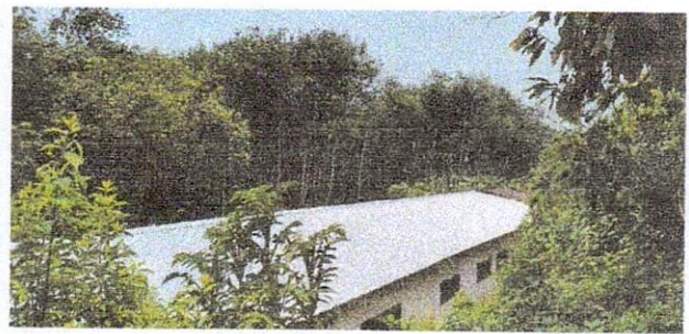
Foto 4: Ahora la Escuela cuenta con láminas nuevas y tubos galvanizados.