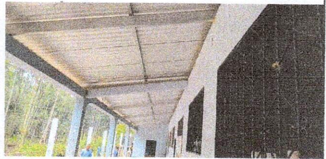
Foto 2: Así quedo el techado con el cambio de láminas y de tubos en la parte de enfrente del corredor.