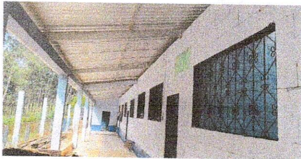
Foto 1: Se cambio la lámina en el corredor de la escuela así tambien la madera por tubos galvanizados.