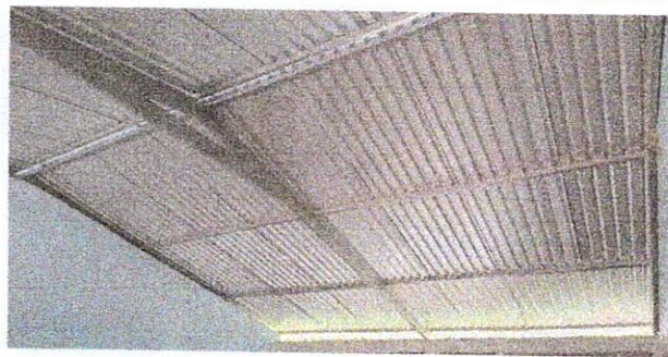
Foto 3: Se cambio en las aulas reglas y láminas por tubos galvanizados.